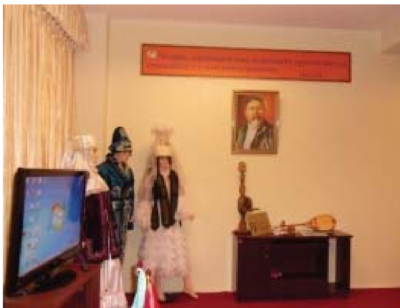
Офис Центра культуры и науки имени Абая в Ханое (Вьетнам)

выпуске международного научного сборника. На данное время уже вышел 1-ый международный научный сборник. Материалы первого номера научного сборника, который вышел в ноябре 2012 года, посвящены актуальным проблемам истории, педагогики, филологии и методики преподавания языков. Кафедра русского языка ХНПУ выразила заинтересованность в возможности сдачи вьетнамскими