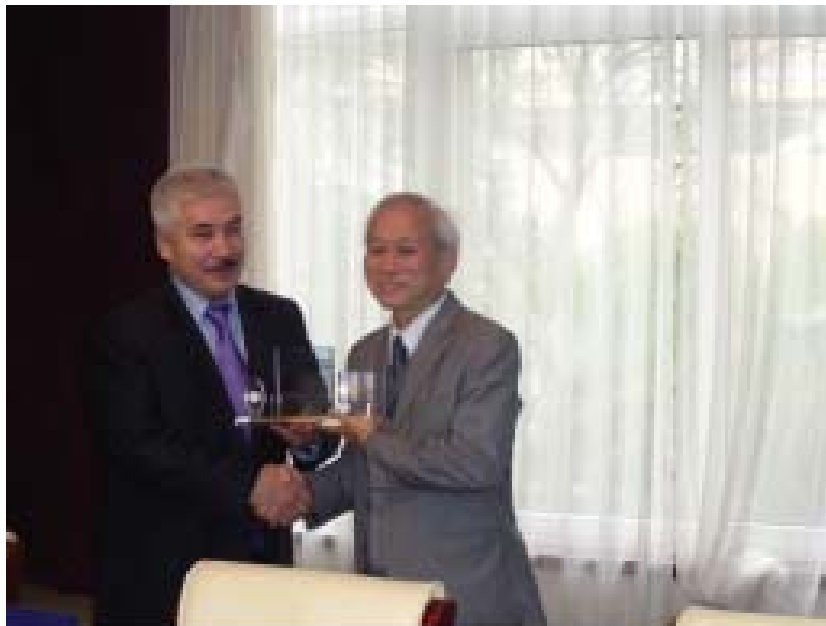
Вручение памятных сувениров представителям ХНПУ (Вьетнам)

В интересах взаимовыгодного сотрудничества в области высшего образования, науки и культуры КазНПУ имени Абая (Республика Казахстан) и ХНПУ (Республика Вьетнам) была достигнута договоренность об осуществлении совместных научных проектов и консультаций, организация стажировок преподавателей и обмена студентами в рамках сотрудничества между университетами, о