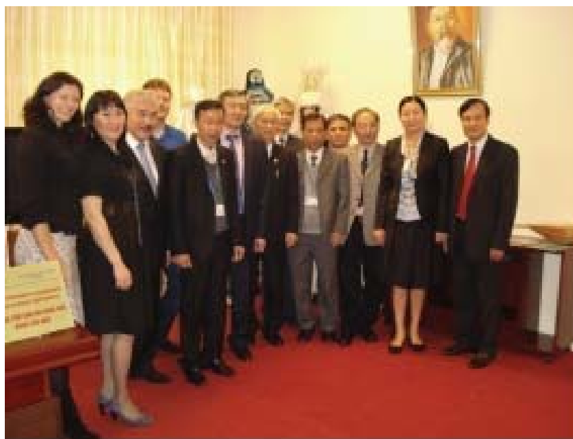
Представители КазНПУ имени Абая (РК) и ХНПУ (Вьетнам)