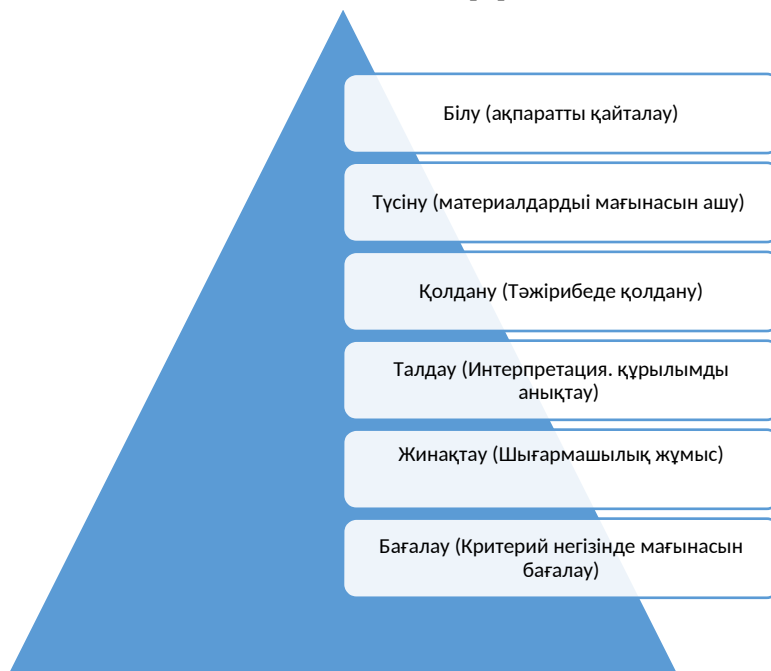
Кесте 1. Блумның білім беру мақсаттарының таксономиясы

Кіріспе. Дәстүрлі және заманауи әдістеме, яғни оытудың кез-келген әдісін немесе стратегиясын қолдану үшін оқытушы маңызды факторларды ескеруі қажет: әр студенттің қызығушылығы, мотивациясы және интеллектуалды қабілетінің деңгейі. Ол оқуды білімгерлердің даму процесін кезең-кезеңімен түсінуден бастауы керек. Блумның білім беру мақсаттарының таксономиясы когнитивтік салада алты санаттың иерархиясын анықтайды [1](кестені қараңыз).