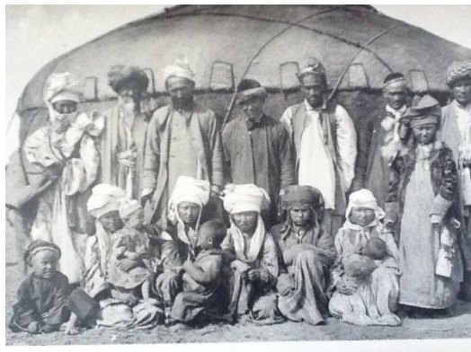
Сырдария облысының (Перовскі уезінің) жергілікті тұрғындары ...

2. Ресей Ұлттық көпшілік кітапханасы, Ресей Ғылым Академиясының кітапханасы мен этнография мұражайының кітапханасы қорларындағы халқымыздың тарихына қатысты ХҮІІІ, ХІХ, ХХ ғғ. жарық көрген, патша өкіметінің тұсында жарық көрген еңбектерге сипаттама жасар болсақ, бұл жерде халқымыздың тарихына қатысты жазбаша деректердің көптігінен көз тұнады. Бұл жерде жекелеген ғалымдардың әр жылдары ғылыми жұмыстарына қатысты, зерттеу жұмыстарына байланысты жұмыс істеп кеткенін байқауға болады. Оларға байланысты мәліметтерді тіркеу парақшаларынан байқадым. Сонымен, бұл жердегі кітаптардан Сырдария облысының тарихына қатысты жазбаша деректер мен фото суреттерді іздестіріп, олардың көшірмелеріне тапсырыс беріп, көптеген құнды деректер мен карталардың т.б. көшірмелерін жасатып, біршама жұмыс жасағанымды атап кетуге болады.