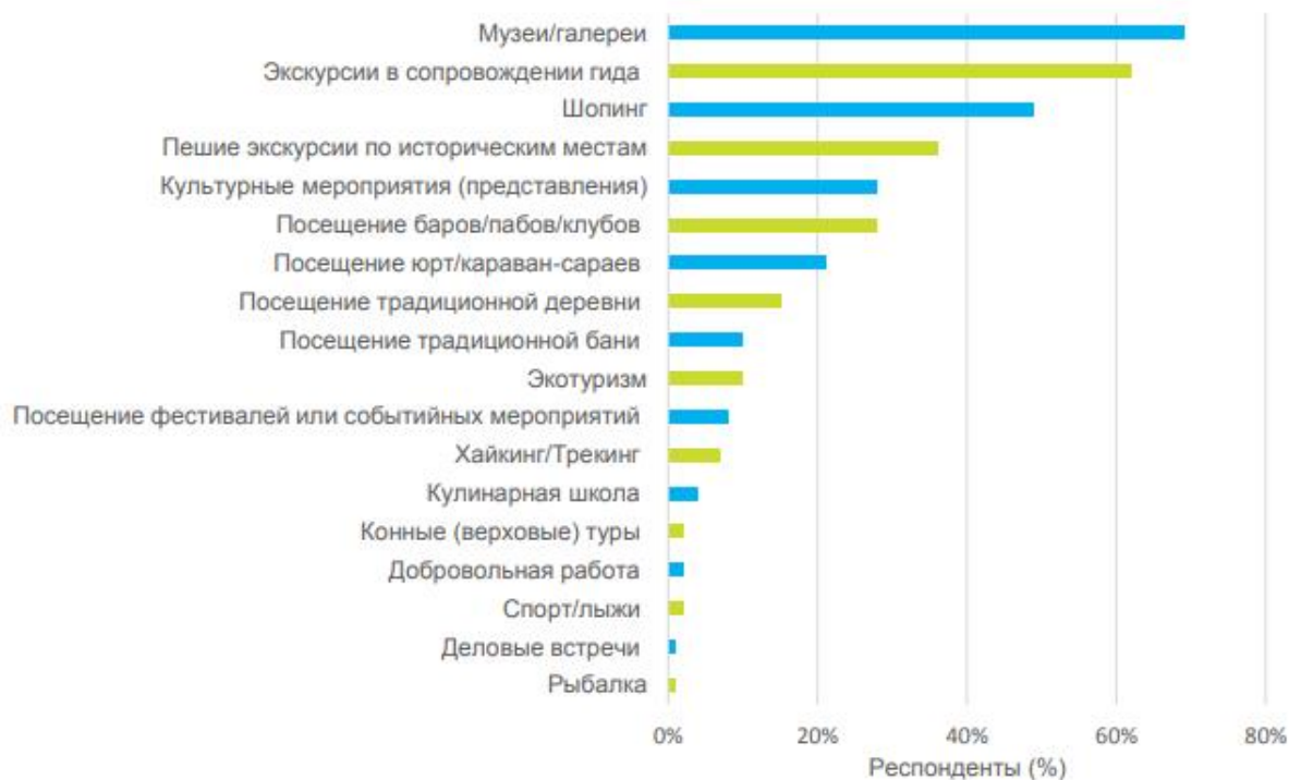
Диаграмма 4 - Предпочтения респондентов в отношении турпродуктов (%)

Также, стоит отметить результаты опроса международных туристов, посещающих Казахстан 2017 года, который представлены в диаграмме 2. Опрос говорит о том, что респонденты в наибольшей степени интересовали впечатления, связанные с посещением музеев и галерей (69%), экскурсии в сопровождении гида (62%) и шопинг (49%). Из ответов на опросник также прослеживается ряд тенденций, связанных с возрастом и полом туристов. Среди туристов в возрасте от 17 до 24 лет вероятность участия в экскурсиях, связанных с экотуризмом, и в фестивалях/культурных мероприятиях была выше, в среднем, на 14%, а в верховых экскурсиях на лошадях – на 9%, по сравнению с туристами всех остальных возрастных групп. Вероятность посещения туристами этой возрастной группы баров, пабов или клубов во время их путешествия также была выше, в среднем, на 35%. Среди респондентов в возрасте 55 лет и выше вероятность участия в шопинг-турах была выше на 30% и в экскурсиях в сопровождении гида – на 40%, по сравнению с туристами всех остальных возрастных групп. Вероятность участия туристов-женщин во время пребывания в РК в экскурсиях в сопровождении гида, посещения культурного мероприятия и музея была выше на 12%, и на 25% выше - в отношении посещения магазинов. Из ответов туристов-мужчин можно предположить, что вероятность посещения имибара или клуба во время поездки по стране была выше на 11%, а хайкинга или трекинга – на 4% выше (Диаграмма 4).