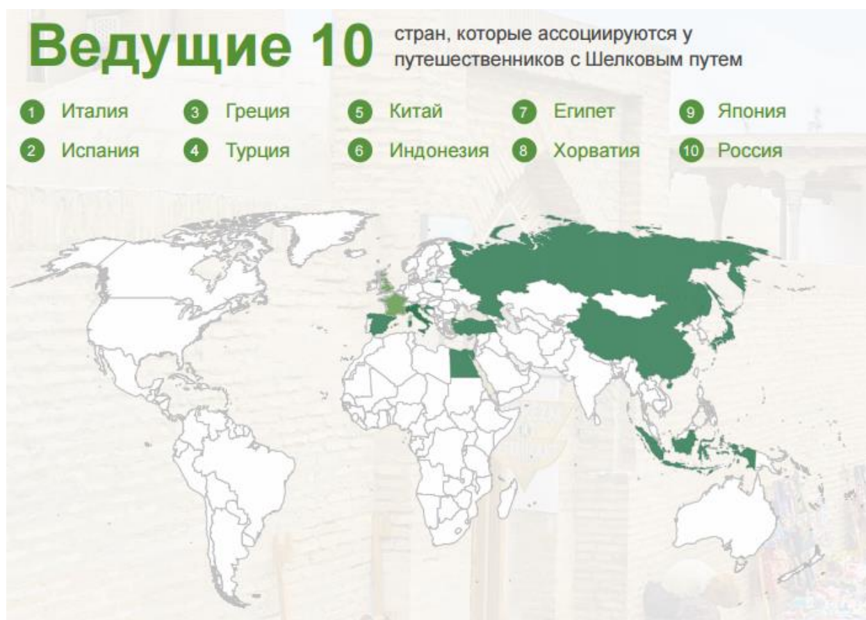
Рисунок 10 - Ведущие 10 стран, которые ассоциируются у путешественников с Шелковым путем.

В феврале 2017 г. TripAdvisor провел опрос потребителей, чтобы узнать мнения путешественников о Шелковом пути. В опросе приняло участие 15 711 респондентов, и основные полученные из него выводы приведены на рисунке 13. Как можно заметить на рисунке 7, что у опрошенных Казахстан не вошел в список стран, которые ассоциируется у путешественников с Шелковым Путем.