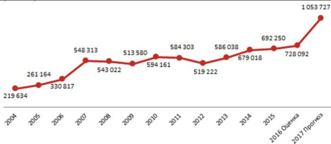
Диаграмма 3 - Количество нерезидентов РК, обслуживаемых в местах проживания

В 2016 году наибольшее количество запросов о странах Шелкового пути, сделанных путешественниками со всего мира на сайте TripAdvisor, было посвящено Италии. Эта страна была в том же году и основным рынком выездного туризма, представители которого активнее всего искали информацию о странах Шелкового пути.