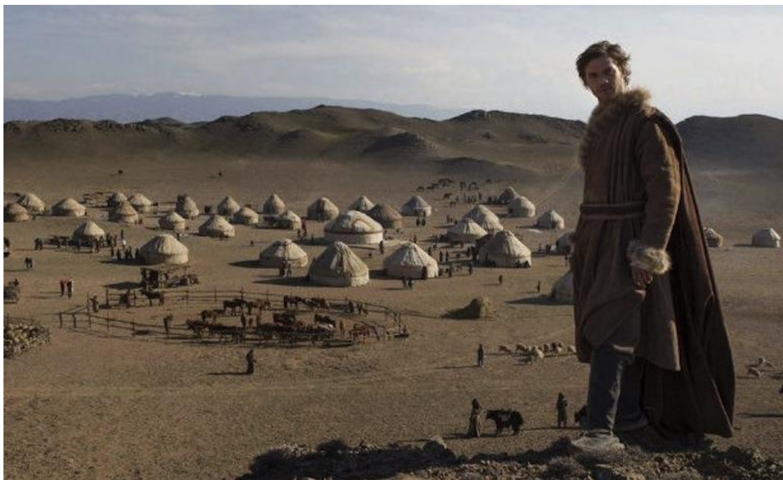
Рисунок 9 – Лоренцо Рикельми (исполнитель роли Марко Поло) в поселке Аласа [62].

Одним из возможных причин интереса туристов к Великому Шелковому Пути на территории Казахстана, мог стать сериал «Марко Поло» производства «Netflix» выпущенный в 2015 году. Часть эпизодов снимались в песчаных барханах и в Чарынском каньоне, поселок Аксай стал местом действия битвы, а в поселке Аласа (Рисунок 9) был построен аул, в котором по сюжету сериала живет брат Кублай-Хана [4].